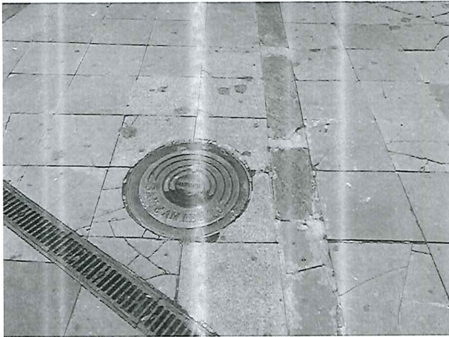
Reposición con granito