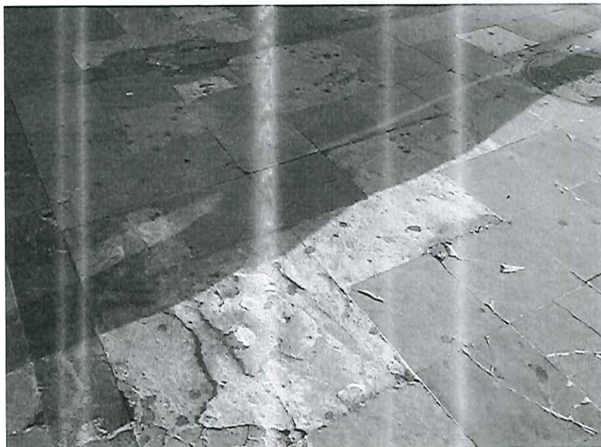
Reposición con mortero